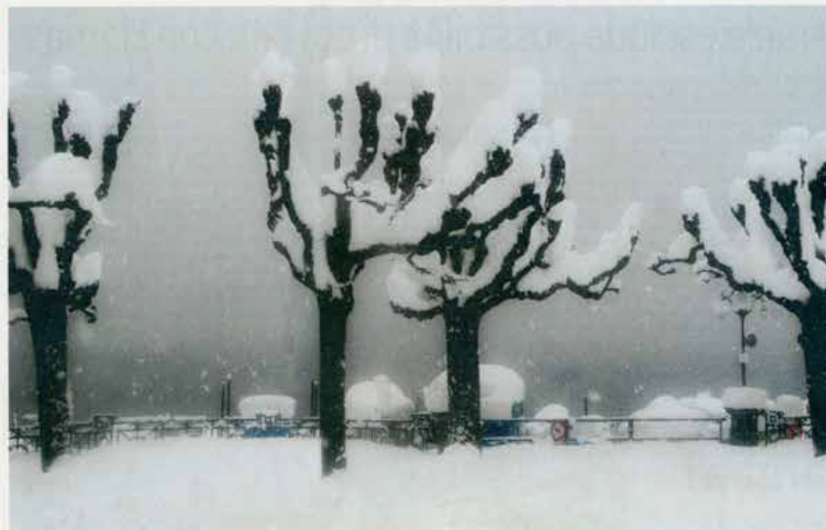
LUNGOLAGO Lugano in versione invernale: ovattata, silenziosa, magica, quasi lunare in un giorno diverso. Storico...